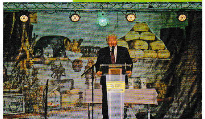
Jakab István, az Országgyűlés alelnöke, az expo fővédnöke