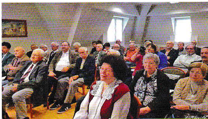
Idén Balatonfüreden találkoztak a Balaton régió helytörténészei