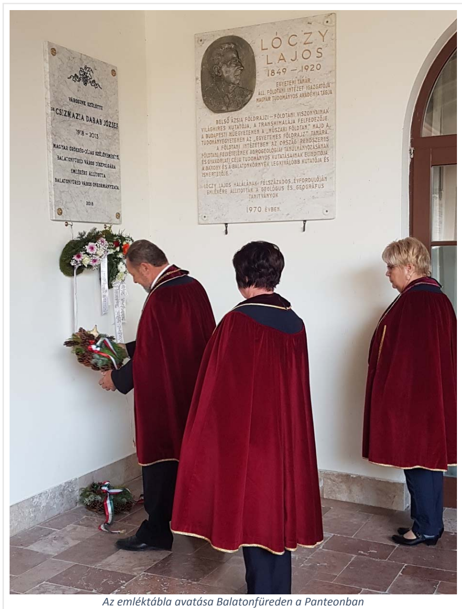
Az emléktábla avatása Balatonfüreden a Panteonban

Köszönöm családom nevében Balatonfüred Város Önkormányzatának, a Balatonfüredi Helytörténeti Egyesületnek, a Balatonvin Borlovagrendnek, minden fürdőnek és valamennyi jelenlevőnek, hogy őrzik édesapám emlékét.