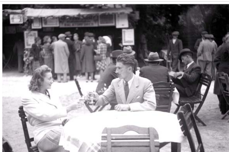
1939-ben a Balatonfüredi Borhétén testvérével a család sátra előtt

1948-ban svájci szakmai gyakorlata során állásajánlatot kapott a Schenk cégtől Rolle-ban, a vállalat dél amerikai szőlőtelepeinek irányítására, de szüeleire való tekintettel inkább hazatért.