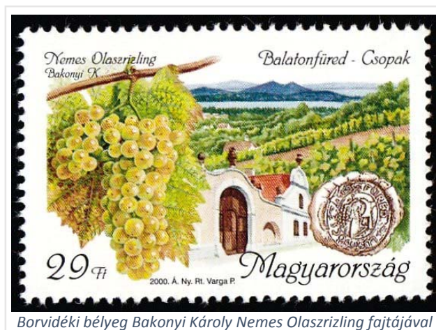
Borvidéki bélyeg Bakonyi Károly Nemes Olaszrizling fajtájával